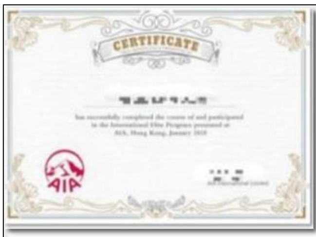
香港实习证明（样例）