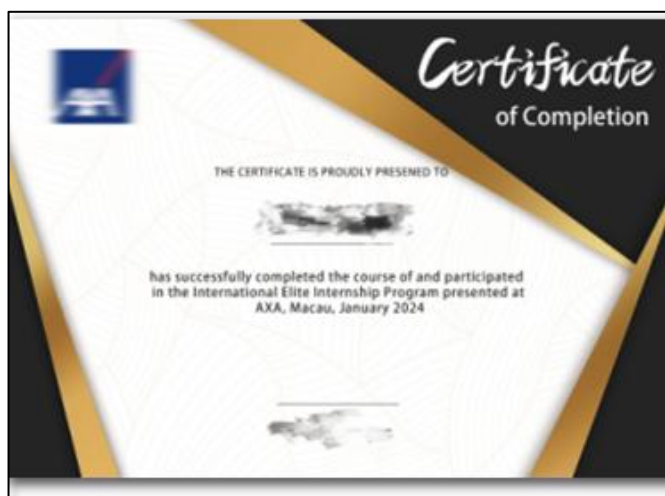
澳门实习证明（样例）