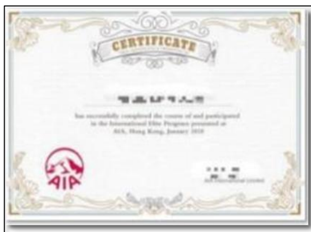
香港实习证明（样例）