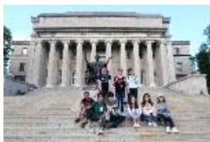
纽约大学校园参访