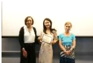
哥伦比亚大学参访